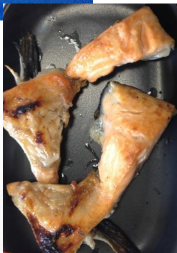
● 焼成後 → ●

商品特長：贅沢にカマ部位を大きく切り取って仕上げた商品です。カマは胸ヒレを動かし筋肉が発達しているため引き締まった身が楽しめる美味しい部位です。一切れずつIQF凍結してご使用時に使い易い仕立てに仕上げております。量販店での販売、居酒屋の一品メニューにいかがでしょうか。